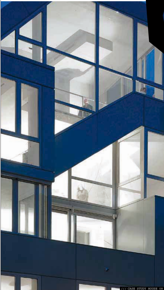
/// CASE STUDY HOUSE 08

PAR / BY : NATHALIE ROY